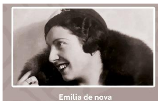
Emilia de nova

Fonte : Pintos Barral, Xoana. Tiven a chave, a bicicleta e os catro libros : primeiras científicas na Universidade de Santiago. Vigo : Galaxia , 2021