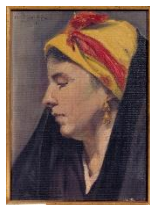
Retrato de campesina.