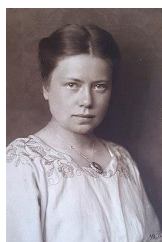
Margot Sponer (1920).