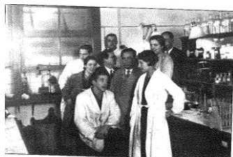
Alumnas e alumnos nun laboratorio de Ciencias

Alumnas e alumnos nun laboratorio de ciencias.