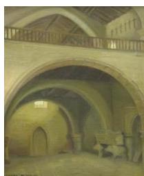
Convento de San Francisco (1932)

A partir de : "M a do Carmo Corredoira" en VVAA; Artistas Galegos. Pintores (rexionalismo III) , Vigo, Nova Galicia Edicións, 1999, p. 99