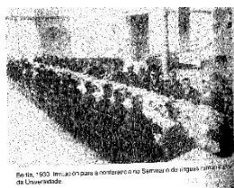
Invitación para a conferencia no Seminario de linguas románicas. Berlín, 1930