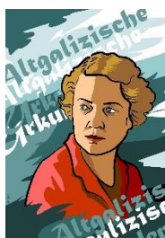
Retrato de Margot Sponer (Ilustración dixital).

A partir de : Alfred Pieperhoff - http://willisch.eu/41_SponerBilder.html