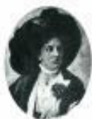
Retrato de María Corredoyra publicado no cartel da Exposición Regional Galega de 1909

( https://gl.wikipedia.org/wiki/Mar%C3%ADa_Corredoira#/media/Ficheiro:Mar%C3%ADa_Corredoira_1932.jpg )